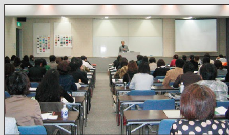
セミナー会場風景

各分野に精通した色彩指導者をご紹介させていただきます。当社営業所へご一報ください。